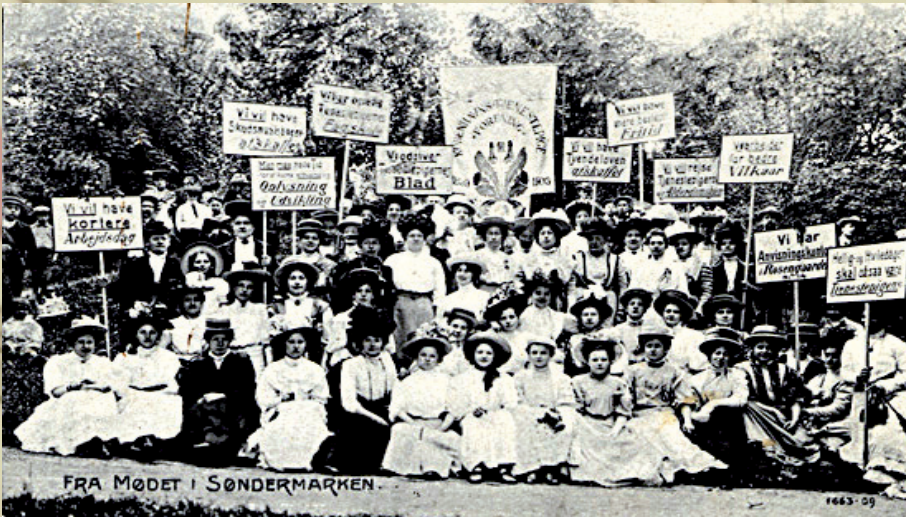
KVINDEMUSEET I DANMARK OG 8. MARTSSAMARBEJDET