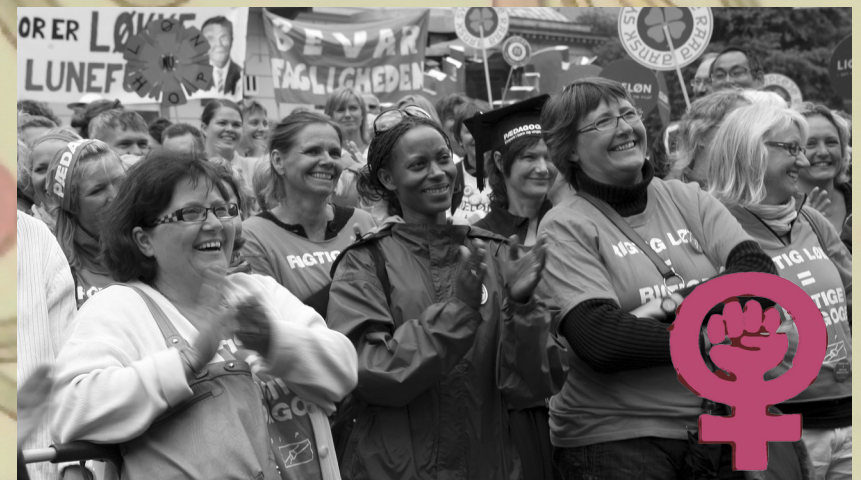
KVINDEMUSEET I DANMARK OG 8. MARTSSAMARBEJDET